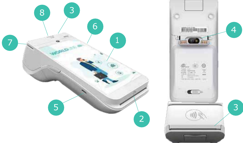
Foto esemplificativa del terminale Hi-POS.

Hi-POS mini condivide le stesse caratteristiche tecniche eccetto la stampa dello scontrino